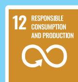
負責任的消費與生產