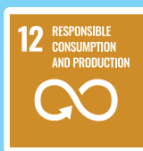
負責任的消費與生產